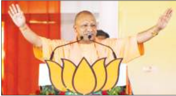
'बंगाल को हिंदू विहीन करने की साजिश कर रहे तृमूल'